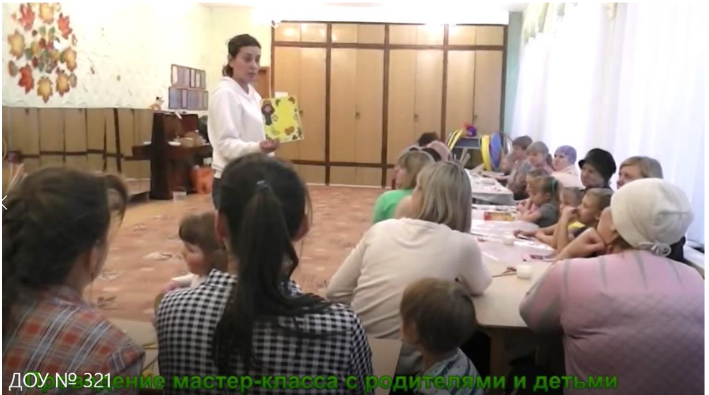
Проведение мастер-класса с родителями и детьми