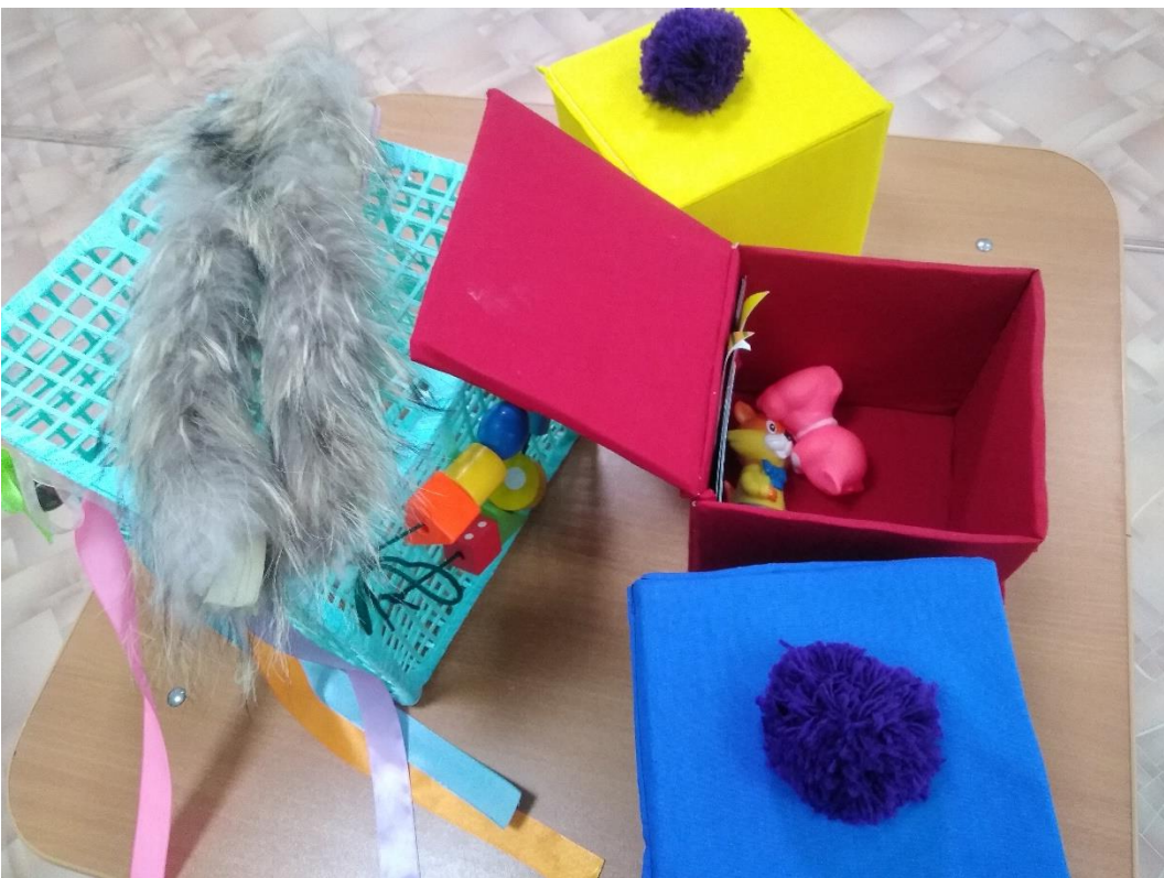
Сенсорный кубик, цветные кубики группа № 1