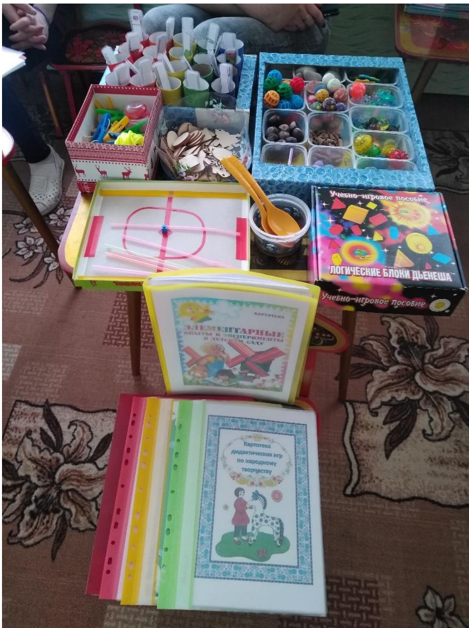
Материалы для мелкой моторики рук («Сенсорные шарики»), группа № 4