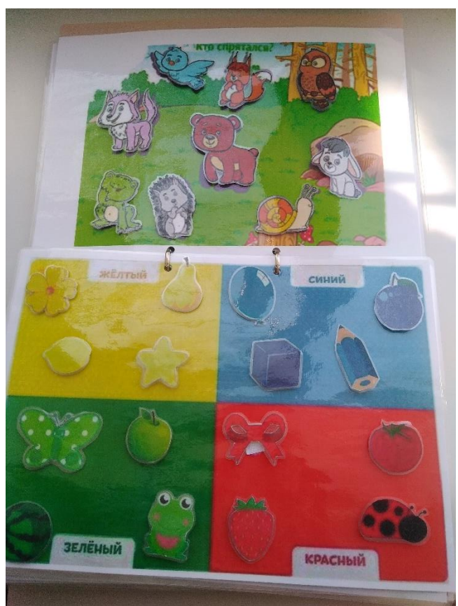
Тематические картинки «Умные липучки», группа № 10