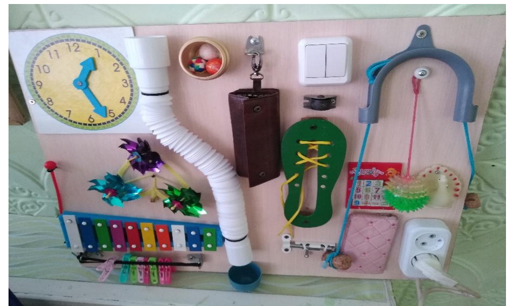
Бизиборд, группа № 8